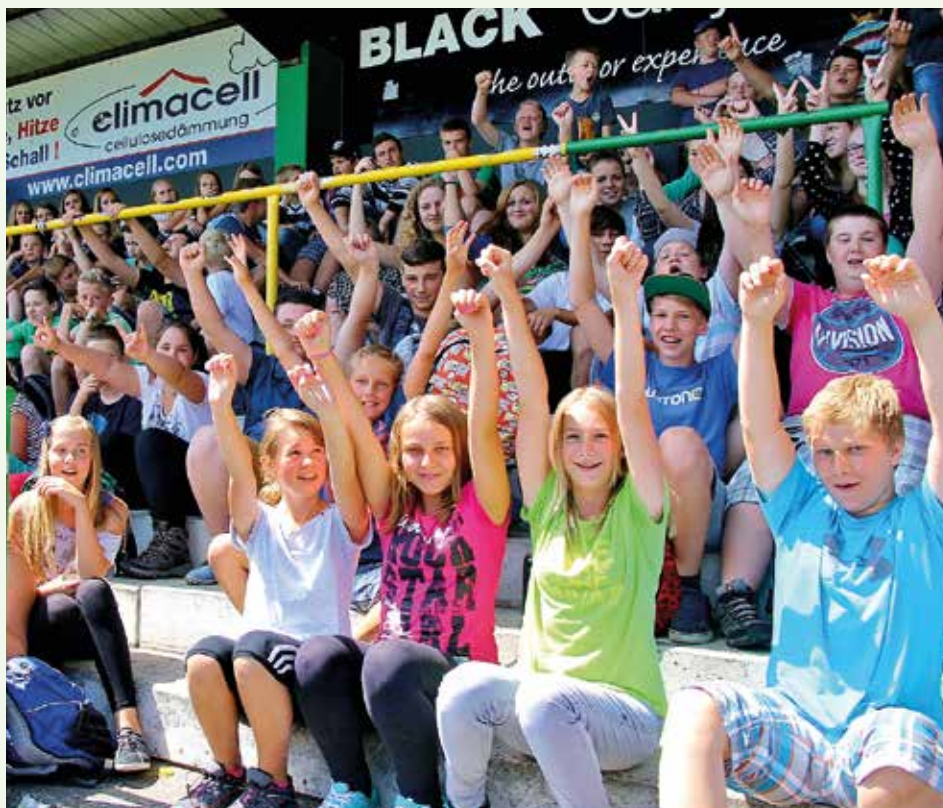
Begeisterte, vor allem junge Zuschauer, verfolgten das Spielgeschehen und die großartige Fußballstimmung in Vöcklamarkt.

Ich möchte mich auf diesem Wege nochmals bei allen an den Vorbereitungen und an der Ausführung Beteiligten herzlich bedanken.