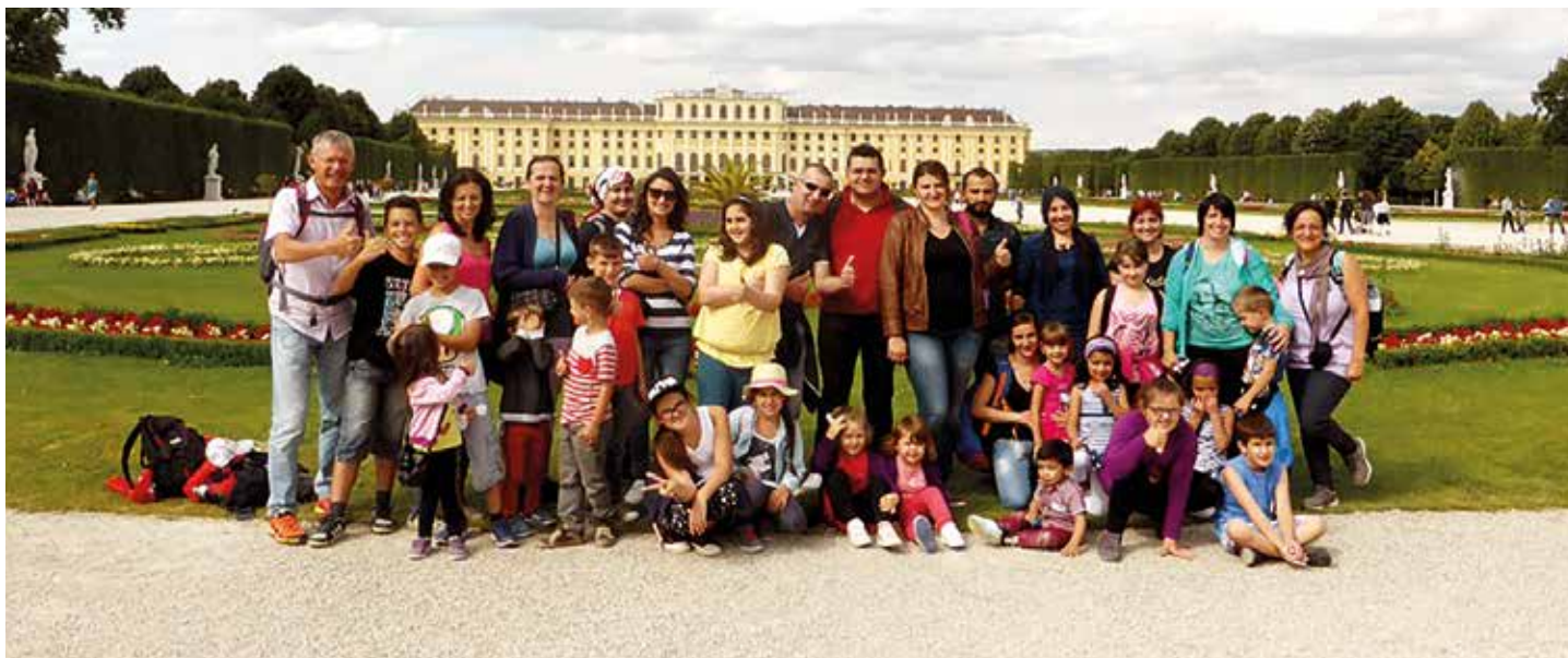
Viele gemeinsame Aktivitäten stehen im Laufe des Jahres beim Rucksackprojekt am Programm.

Weitere Informationen zum Rucksackprojekt erhalten Sie im Meldeamt der Marktgemeinde Vöcklamarkt bei Frau Nikolić Sladjana, Tel. 07682/2655-22.