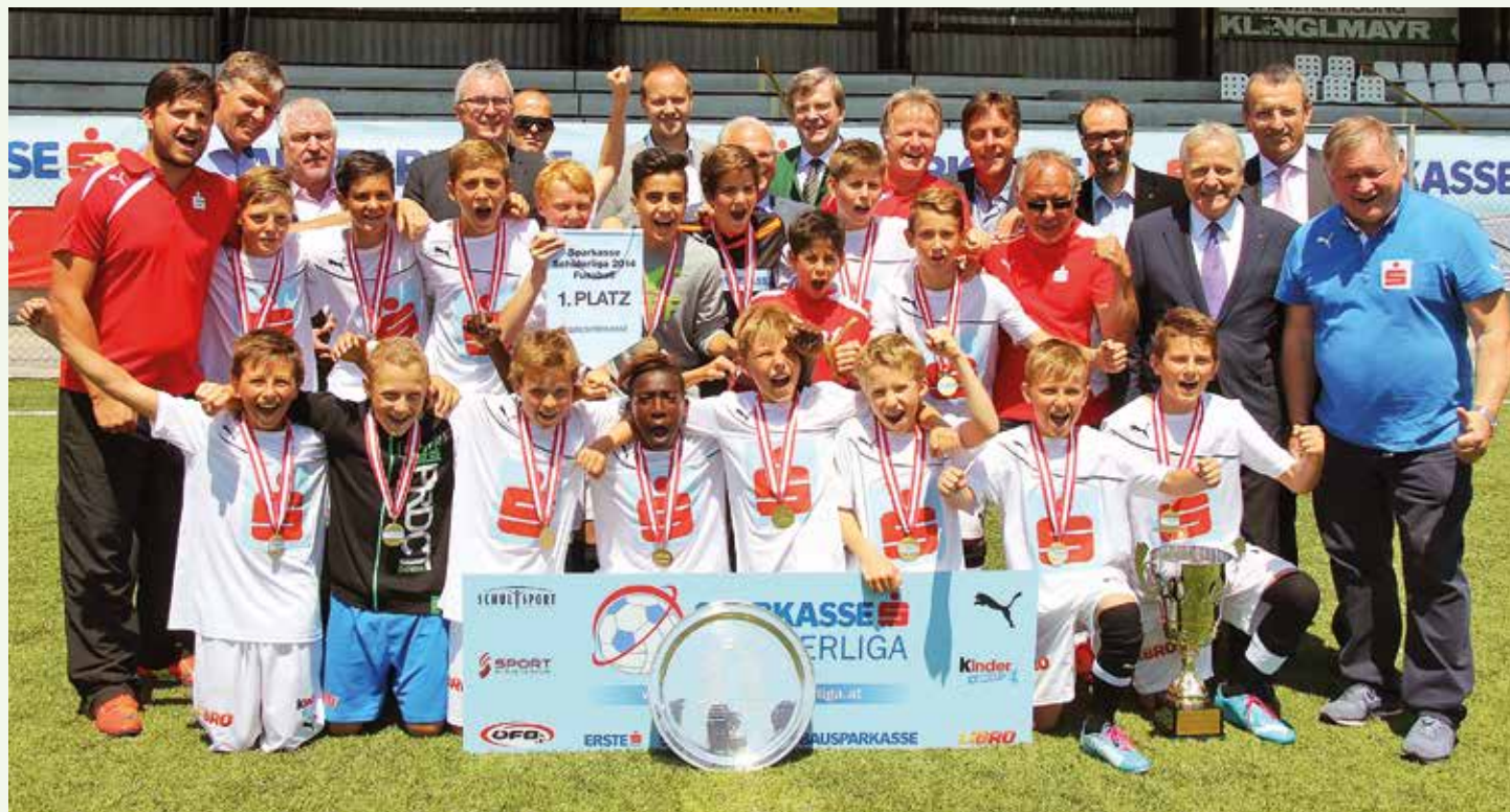
Die siegreiche Mannschaft der Praxis-NMS Salzburg mit ihrer Trophäe.