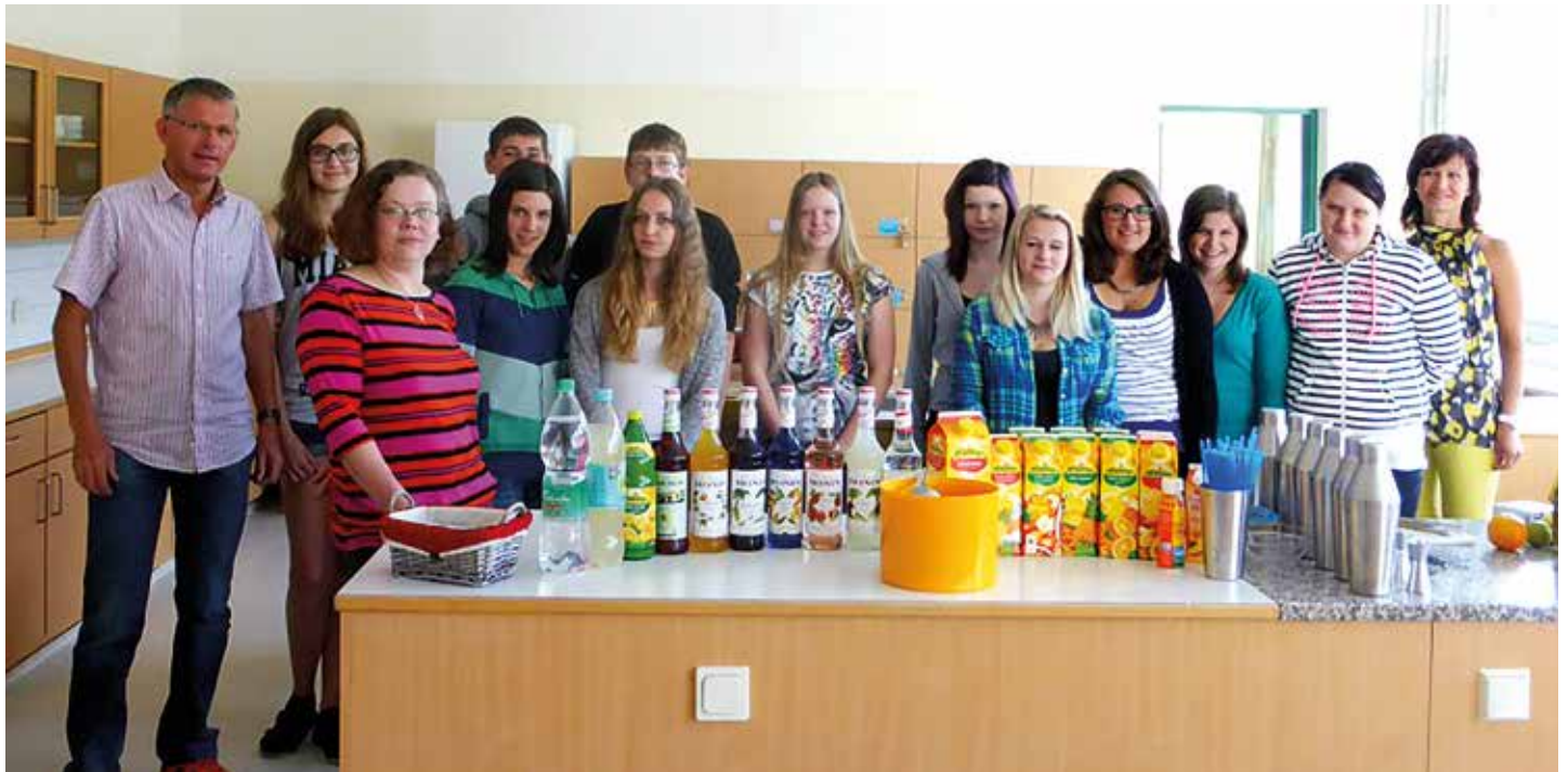
Dieses bedeutende Projekt, welches durch den Sozialausschuss der Marktgemeinde Vöcklamarkt ins Leben gerufen wurde, fand bereits zum zweiten Mal statt.

Damit wurde ein wichtiger Beitrag dafür geleistet, dass Party und Feiern auch ohne Alkohol attraktiv sind. Unterstützt wurde der Workshop von der Gemeinde Vöcklamarkt in Zusammenarbeit mit „Barfuß“. Nähere Informationen zum Thema unter www.praevention.at