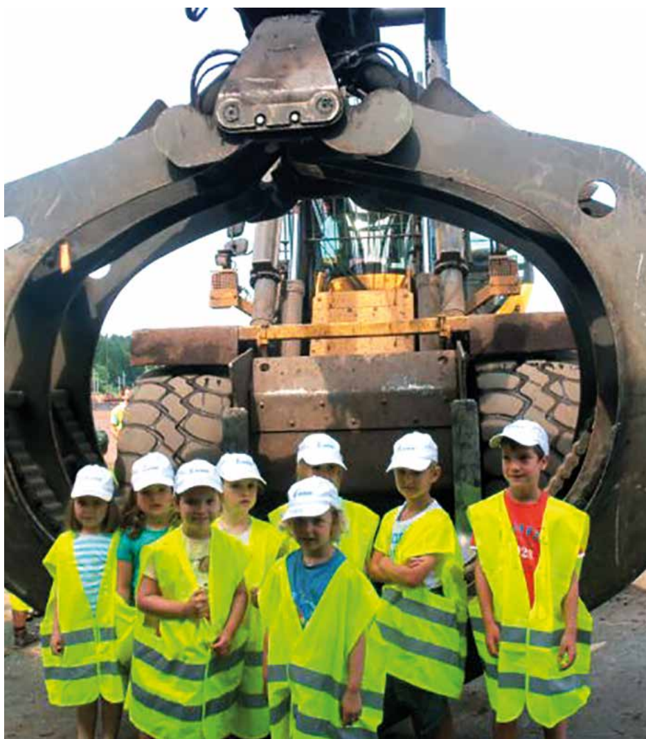
Nach dem Rundgang bekamen die Kinder noch ein liebevoll gepacktes „Bschoadpinkler!“ voll gesunder Leckereien.

Das Team des Pfarrcaritaskindergartens bedankt sich auf diesem Weg bei der Geschäftsführung und den engagierten Mitarbeitern der VM-Holz, die diesen spannenden und interessanten Vormittag ermöglicht haben!