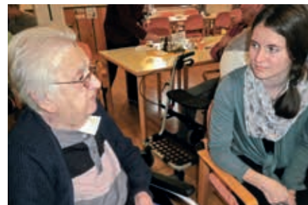
Die Schülerinnen und Schüler erfuhren durch die Erzählungen der älteren Generation Erstaunliches aus deren Zeitgeschichte.