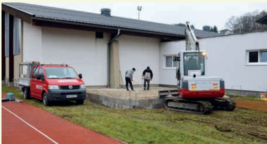
Mitarbeiter des beauftragten Bauunternehmens arbeiten gemeinsam mit freiwilligen Helfern der Sektion Tischtennis am Lagerhallenzubau.