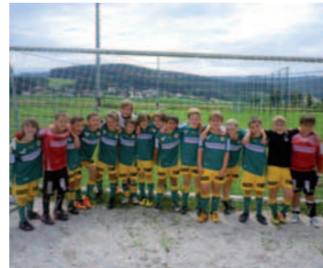
Die siegreiche Fußballmannschaft.

Die Volksschule Vöcklamarkt darf sich auch noch über einen weiteren Erfolg freuen, sie wurden auch noch Fußball-Bezirksmeister!