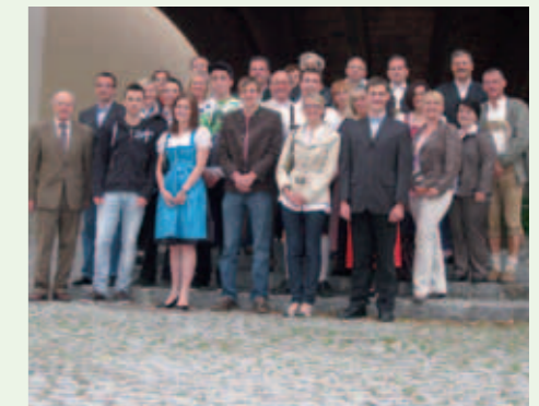
Jungbürgerfeier 2011 - Jungbürger mit Eltern, Sozialausschuss und Gemeinderatsmitgliedern.

Leider hielt sich der Besuch der Eingeladenen sehr in Grenzen. Die anwesenden Jungbürger, sowie deren Eltern waren jedoch über die Aufmachung der Veranstaltung erfreut.