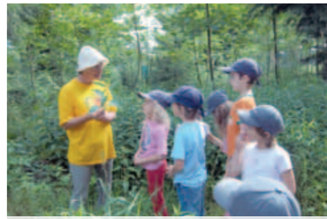
Auf Kräutersuche im Markterwald.