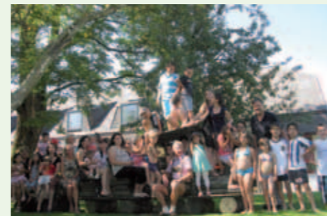
Abschlussfest des Integrationsprojektes „Rucksack“.

Da das Rucksackprojekt ein wichtiger Beitrag zur Integration und Förderung der Vöcklamarkter Einwohner mit Migrationshintergrund ist, wurde in der Gemeinderatssitzung am 30. Juni 2011 beschlossen, das Projekt im nächsten Schuljahr weiterzuführen.