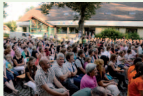
Das Publikum war begeistert von den Darbietungen der Musikklassen.

konzert am 28. Juni 2011 im Musikpavillon den vielen Besuchern.