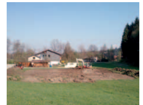
Vorbereiten der Festwiese für das Inselfest

Die FF Wilding-Mühlberg möchte sich auf diesem Weg herzlich bei der Firma Erdbau Strubreiter bedanken.