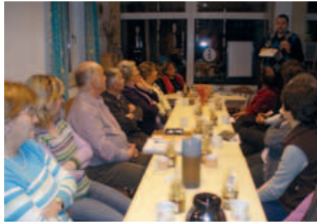
Seminare dienen der Fortbildung

Heuer ging es am 1. Juli 2011 ins schöne Mondseeland, mit Führung in der Basilika und bester Jause in der Erlachmühle.