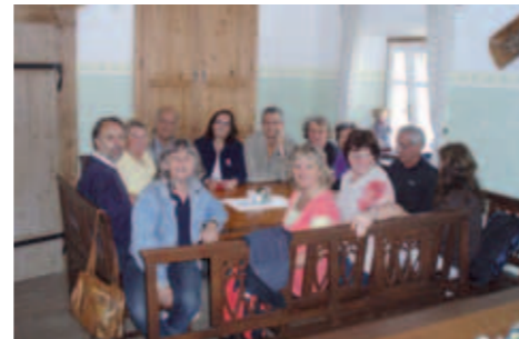
Gemütlicher Ausflug des Besuchsdienstes