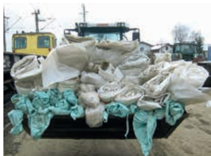
Angenommen werden: Rundballenwickelfolien, Fahrsilofolien, Gemüsefolien, Baufolien, Abdeckfolien, Düngemittelsäcke.